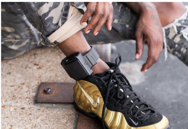
A man wearing an ankle monitor.

Կիրառվող մեխանիզմները կարող են տարբերվել, տարբեր են նաև սարքերը: Օրինակները ցուցադրված են երեք լուսանկարներով, որոնք ակտիվ են դեպի սկզբնաղբյուրներ: