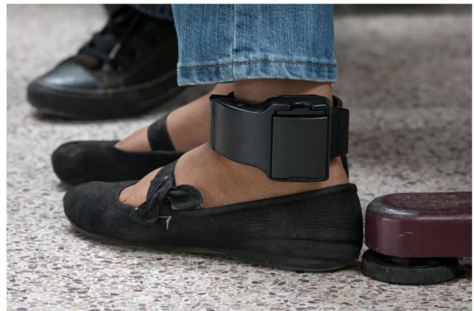
An ankle monitor is seen on a migrant woman from El Salvador. She was released from federal detention with fellow Central American asylum seekers at a bus depot in McAllen, Texas, on June 12, 2019.